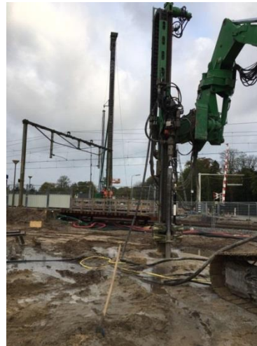
Foto 2. Funderingspalen boren.