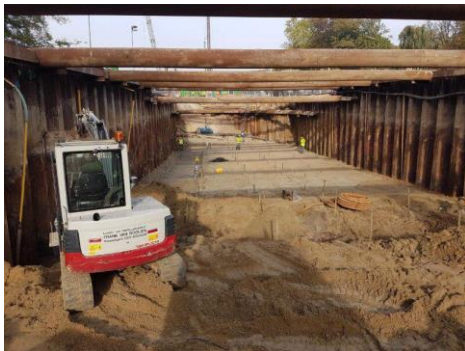
Foto 1: eerste deel van de (westelijke) onderdoorgang bij Hoofdstraat is ontgraven.