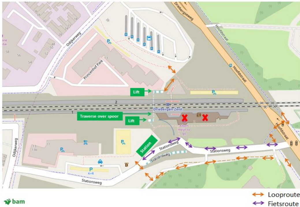
Afbeelding 2. Situatieschets stationsgebied vanaf 2 oktober 5.00 uur